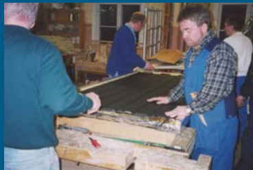
Maalatu absorptiolevyt kiinnitetään keräimeen.