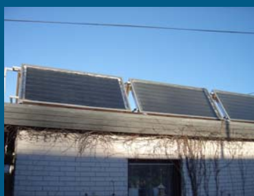
Valmiiksi asennettuja aurinkokeräimiä.