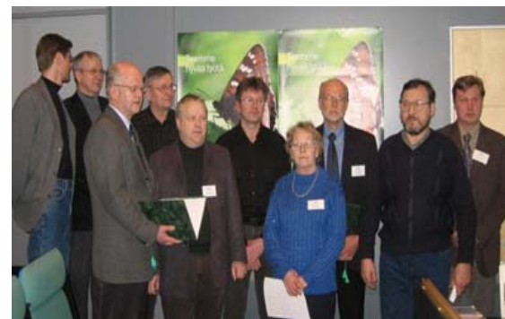
Yritysten ja kunnan edustajat allekirjoittamistilaisuudessa

Lisätietoja ja raportit luettavissa: www.rantasalmi.fi/palvelut/yritysinfo/ekoteollisuuspuisto/ ja www.promidnord.net