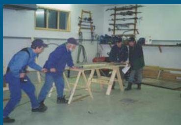
Kuvasarja aurinkokeräimen tee-se-itse -kursilta.