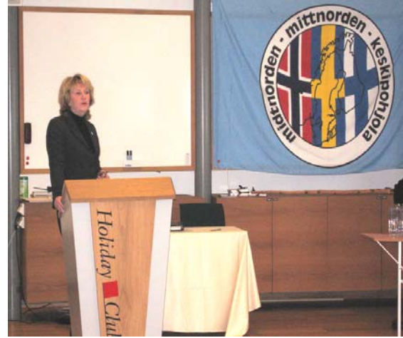
Kuva yllä: Ruotsin sosiaali- ja yhteistyöministeri Berit Andnor.

piti kattavan ja mielenkiintoisen esitelmän NECL (North East Cargo Link) -hankkeesta tehdystä Keskipohjolan kuljetuskäytävä - työstä, tutkimuksista ja tuloksista. Kaikki raportit löytyvät hankkeen www-sivuilta: www.necl.se