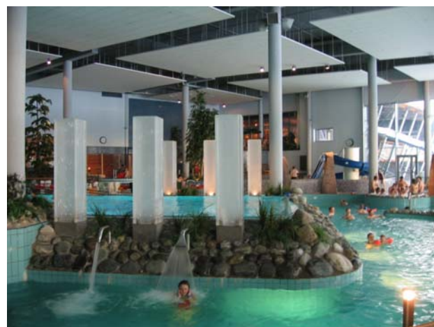
Holiday Club-kylpylässä tehdään EcoStart- ympäristöjärjestelmän mukainen energiakatselmus

Lisätietoja: Timo Lehtonen, projektipäällikkö WP2 Gsm. 040 733 8624 S-posti: timo.lehtonen@esavo.fi